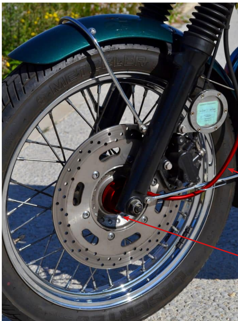
Câble compteur Speedometer cable

Triumphs with electronic speedometer doesn't have drive gear neither this cable.