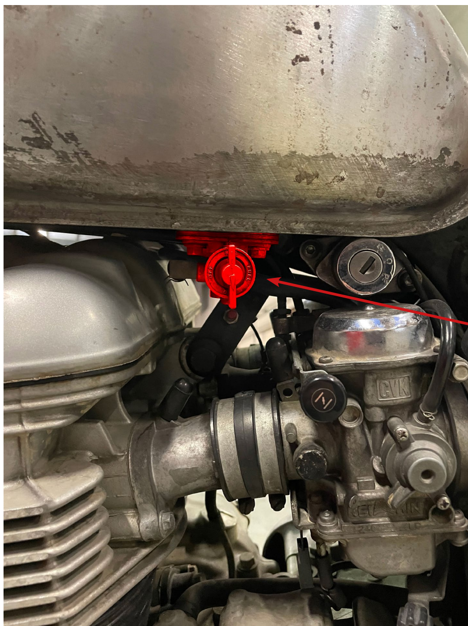
Robinet d'essence Fuel tap

This is the easiest to know, carbureted Triumphs have a fuel tap on the left side of the tank, while injections do not. Also, on injections, the fuel pump emits a typical noise when you switch on the ignition.